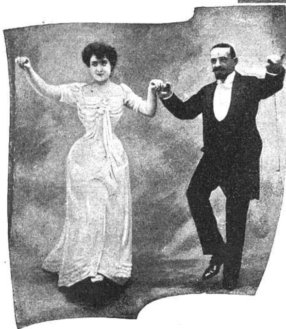
Рис. I. Первая фигура. На Cake-Walk'a впередъ, танцующіе исполняютъ это на первые 8 тактовъ.

1-й тактъ 1-го темпа. Направо, вытянувъ носокъ правой ноги, откинувши тяжесть всего тѣла на лѣвую ногу.