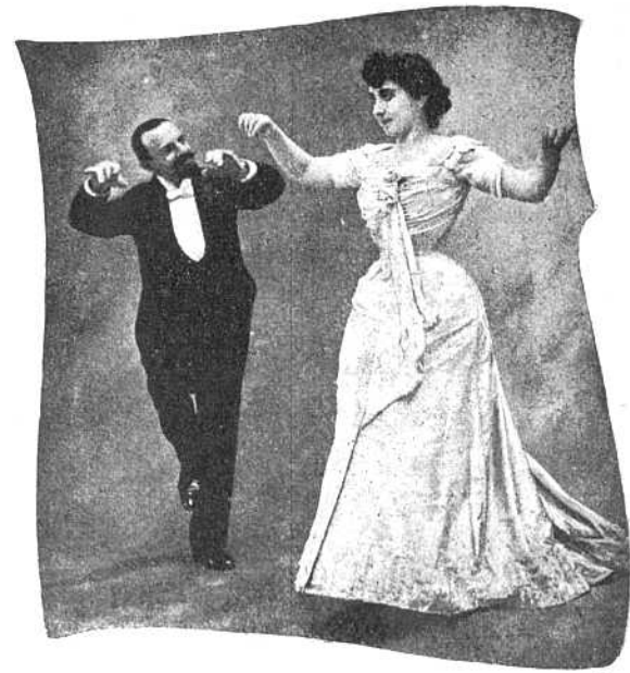
Рис. IX. Пятая фигура. Въ теченіе послѣднихъ 8 тактовъ танцующіе раздѣляются и танцуютъ порознь на Cake-Walk'a.

тактъ они приходятъ въ то же положеніе какъ въ началѣ фигуры.