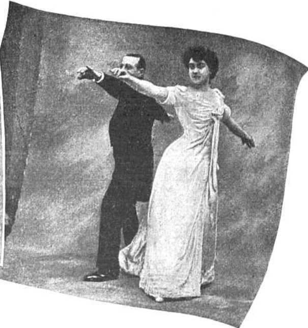
Рис. VI. Четвертая фигура. Танцующіе поворачиваются другъ къ другу попеременно спиной и лицомъ, глѣзая руки.

Первая фигура. Дама по правую руку отъ кавалера, они держатъ другъ друга за руку и въ теченіи первыхъ