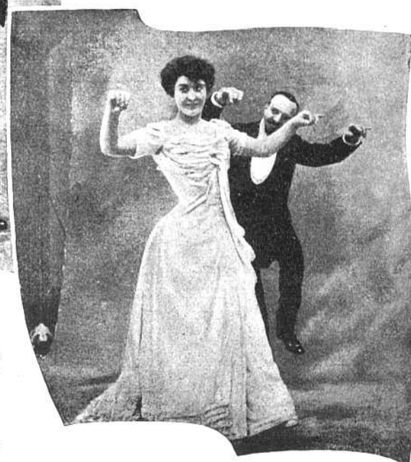
Рис. III. Вторая фигура. Кавалеръ слѣдуетъ за дамой, заглядывая на нея то слѣва, то справа.

Трудно объяснить это: руки надо держать въ полувытянутомъ положеніи, на высотѣ плеча и ими отмѣчать ритмъ