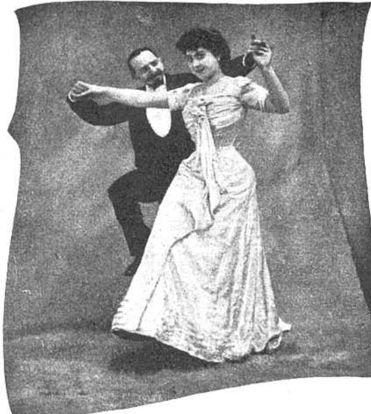
Рис. VIII. Пятая фигура. Кавалеръ и дама возвращаются на мѣста, дѣла на Cake-Walk'a. Кавалеръ сзади дамы, придерживая ее за руки.