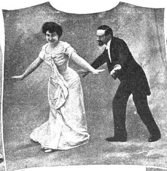
Рис. V. Третья фигура. Въ теченіи послѣднихъ восьми тактовъ дѣлають на правой ногѣ съ помощью лѣвой два полные оборота.

танца, мягко опускаютъ ихъ внизъ. Въ это же время попеременно поднимать довольно высоко ноги, причемъ у мужчинъ колѣни поднимаются на высоту бедра, а у женщинъ немного ниже; ступня ставится на полъ плашмя, а не на носокъ, какъ въ другихъ танцахъ.