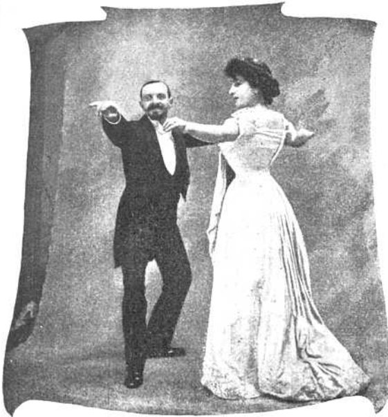
Рис. VII. Пятая фигура. Эта фигура вариация фигуры Washington-Post.

На послѣдніе 8 тактовъ они расходятся и танцуютъ порознь, рядомъ на Cake-Walk'a, возвращаясь къ тому же положенію какъ и въ началѣ.