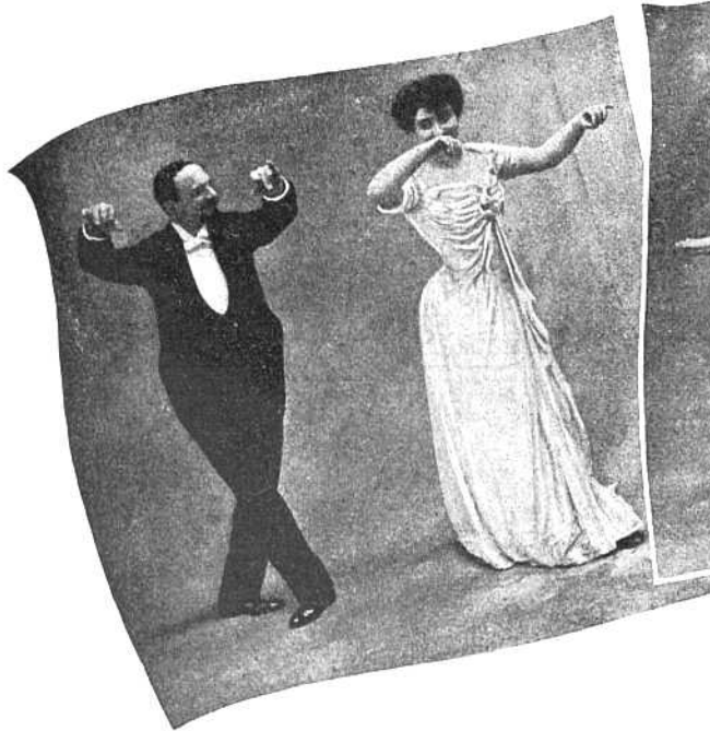
Рис. IV. Третья фигура. Перекрещиваютъ правую ногу черезъ лѣвую.

2-ой темпъ. Лѣвая нога направо на перекрестъ правой, впереди ея.