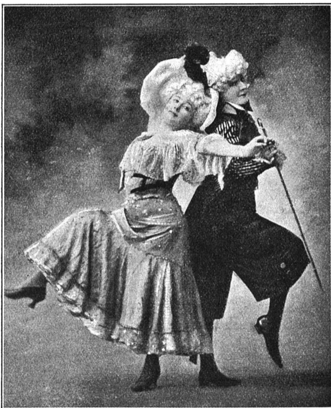
№ 2. Кэкъ-Уокъ (Cake-Walk) на сценѣ.

„Кэкъ-Уокъ“ въ переводѣ значитъ „пирожный маршъ“. Такое названіе дано этому оригинальному танцу вслѣдствіе того, что у негровъ наградой за наилучшее его исполненіе служитъ большой пирогъ. Негры танцуютъ „Кэкъ-Уокъ“ на открытомъ воздухѣ. Старшіе изъ нихъ, составляющіе жюри, сидятъ на возвышеніи, у подножія котораго помѣщается призъ—громадный пирогъ, украшенный цвѣтами. Танцующіе окружены толпой зрителей, музыканты старательно играютъ на своихъ „баньо“, а разряженные танцующія пары прилагаютъ все свое старанье, чтобы получить призъ. Пускаются въ ходъ различныя импровизаціи въ „па“ танца; комическими прыжками и жестами танцующіе стараются обратить на себя вниманіе судей и заслужить ихъ одобреніе.