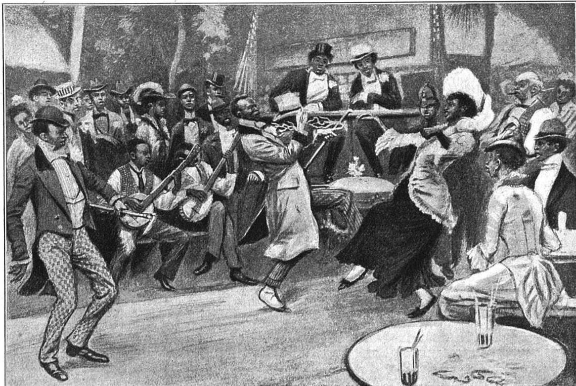
№ 1. Кэкъ-Уокъ (Cake-Walk) у негровъ въ Америкѣ.